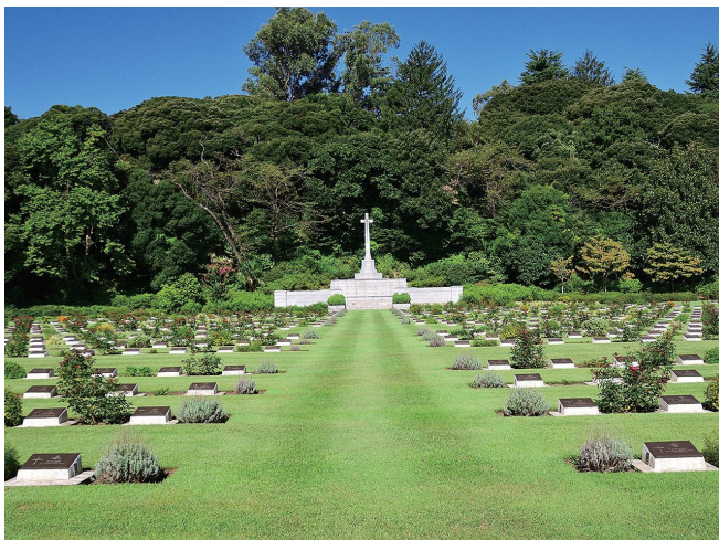
保土ケ谷区 英連邦戦死者墓地